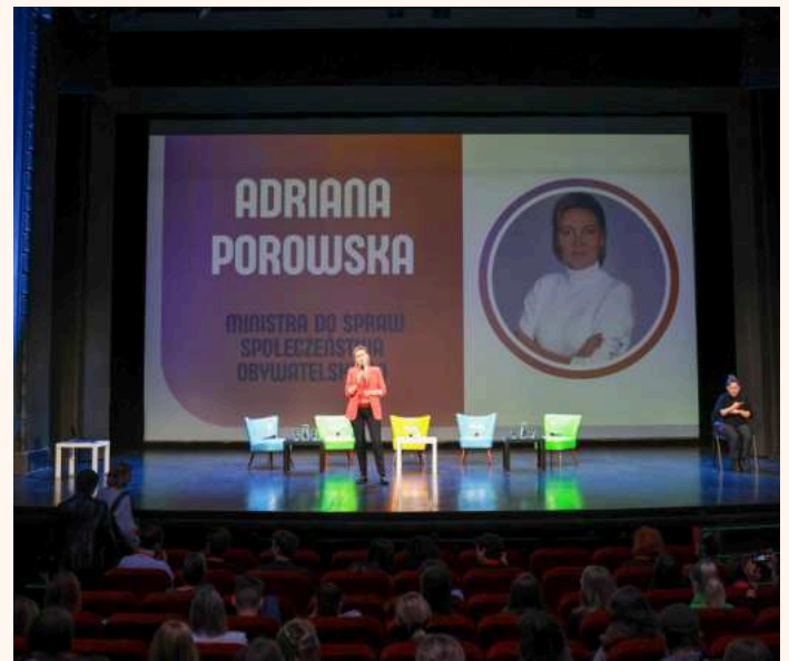
Adriana Porowska | Minister for Civil Society