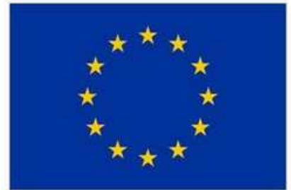
Citizens, Equality, Rights and Values Programme (CERV)