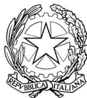
Consolato Generale d'Italia Metz