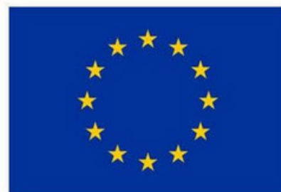
Citizens, Equality, Rights and Values Programme (CERV)